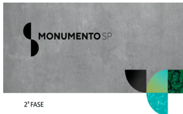
TABELA DE VENDAS PROMOCIONAL