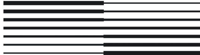
TABELA DE VENDAS