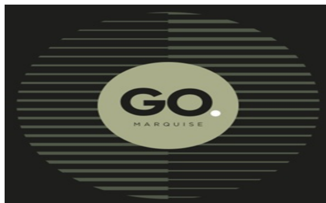
TABELA DE VENDAS